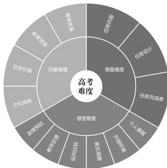
图3 高考难度三维度的影响因素